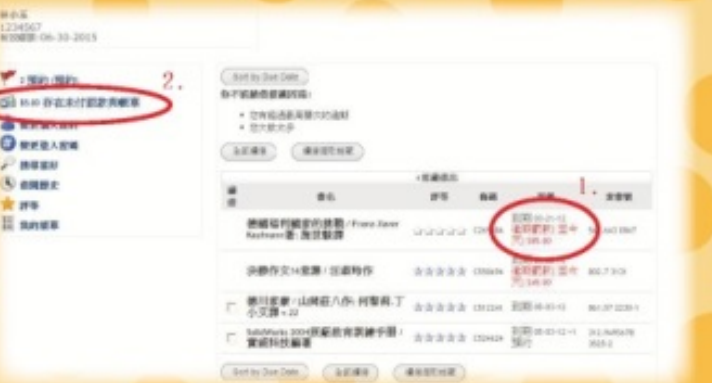
圖七：個人借閱紀錄5