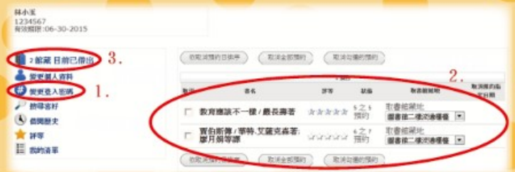
圖三：個人借閱紀錄1