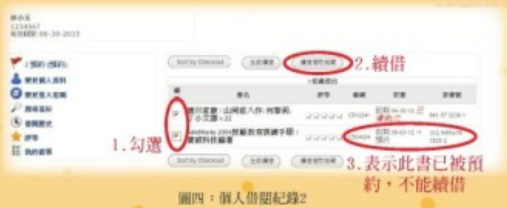
圖四：個人借閱紀錄2