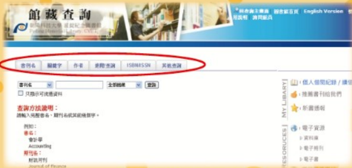
圖一：圖書館館藏查詢首頁