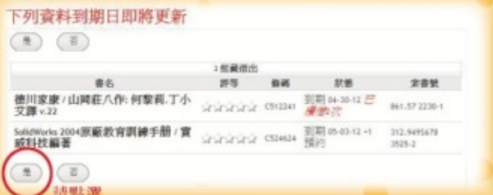
圖五：個人借閱紀錄3