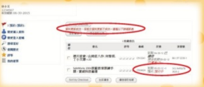
圖六：個人借閱紀錄4